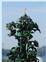
公園内にあるバラの噴水

横須賀軍港めぐりから帰ってきて、歩いてすぐのところにあるのがヴェルニー公園。名前の由来は横須賀製鉄所を設計した人から来ているらしい。公園の目玉であるバラの花畑は清々しいほど全く咲いてなかったが、強い日差しに照らされた海の景色がとても綺麗だった。