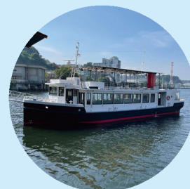
遊覧船 2階席は窓がない

横須賀軍港巡りでは、船に乗りながら日本・米国それぞれが所有する軍艦を近くで見ることが出来る。風に吹かれながら海を進んでいくのは、爽やかで気持ちが良い。案内人の軽快なお話を聞いていると、軍艦がよく知らない人でも45分間があつという間だ。あなたも様々な軍艦に出会い、推し軍艦を見つけてみてはいかがだろうか。