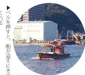
ペルを押すと、船が迎えにくる

叶神社を訪れた。叶神社は東西に分かれている。港を挟み向かい合っており、間を浦賀の渡しで移動する。到着後、その装飾は勿論、閑静な住宅街に現れた大きな鳥居に目を奪われている。狛犬も少々変わっている。特に東叶神社は勝海舟が使用したとされる井戸に加え、2つのパワースポットがあるため、是非訪れてみてほしい。