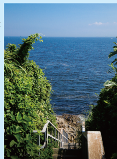
階段を降りると、青い海が迎える

旅の最初は、無人島に上陸。猿島とあるが、猿はいない。砲台跡地や弾薬庫など、戦争の歴史を体感することができる。おすすめスポットは階段を降りたところにある岩場。青い海と空が一面に広がる。「階段を抜けると海であった。眼窩の底が青くなった」